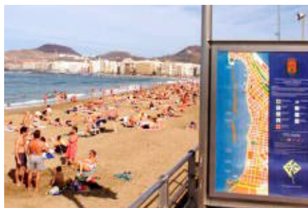
HETT. Spanien är fortfarande det absolut populäraste landet att flytta till.

Di frågade besökarna på Flytta utomlands-mässan i Göteborg om deras bostadsdrömmar.